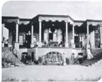
Das Sanatorium auf dem Monte Verità

...auf dem „Berg der Wahrheit“. Monte Verità – so tauft im Jahr 1900 eine Gruppe von jungen Aussteigern einen Hügel über dem Städtchen Ascona in der südlichen Schweiz. Den Pionieren des alternativen Lebens ist die Konsumwelt des ausgehenden 19. Jahrhunderts ein Gräuel.