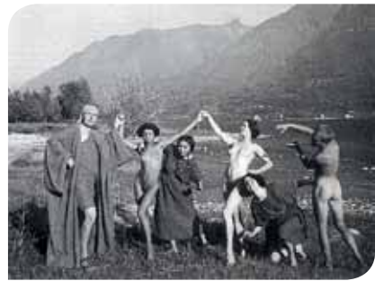
Tänzerinnen und Tänzer am Seeufer

Sie stammen meist aus begüterten Familien und wollen ihr vorbestimmtes Leben hinter sich lassen. Auf dem Monte Verità finden sie ihr Paradies: In wallenden Gewändern oder ganz nackt leben,